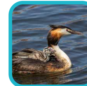
In mei leg elke (water) vogel een ei ...

Hopelijk geniet je deze zomer van het warme weer en de schitterende evenementen in Turnhout.