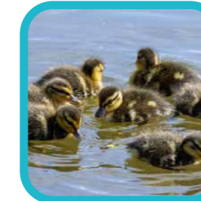
wendyh_fotografie In mei leg elke (water) vogel een ei ...