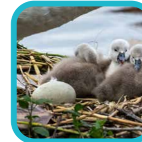
wendyh_fotografie In mei leg elke (water) vogel een ei ...