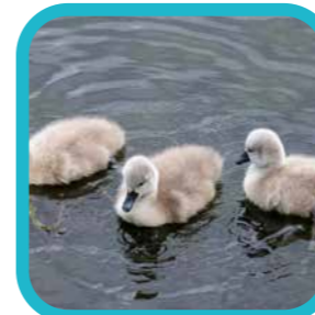
wendyh_fotografie In mei leg elke (water) vogel een ei ...