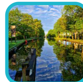
petra.peeters.101 Vroege ochtend wandeling