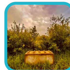
laureyntom Ochtend in Turnhout