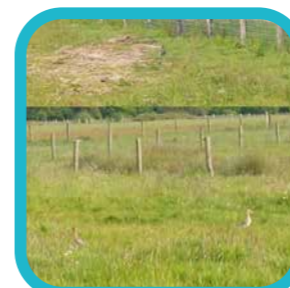
bartbellens Turnhouts Vennengebied