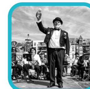
fotos_mundanas This is Turnhout in a frame