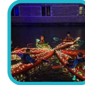
technico_kajak_club Turnhout Kasteel

We vonden weer schitterende foto's op Instagram van enkele inwoners. Doe jij volgende maand ook mee? Trek eropuit om de eerste lentebeelden vast te leggen.