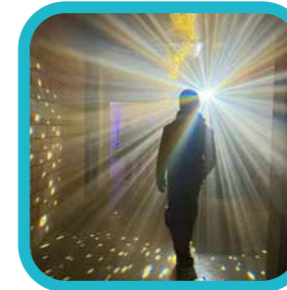
medwinmiyoba About last weekend #turnhoutbynight