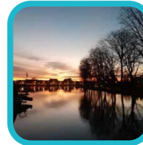
johan_kremers Nieuwe Kaai, ondergaande zon