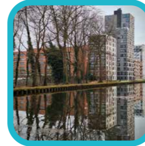
veerle.detroeyer De Nieuwe Kaai 1