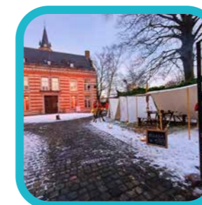
rolandjoris #turnhoutsepatriotten #turnhoutbynight