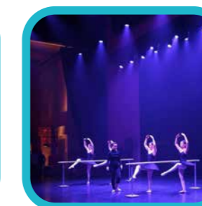
digit.all.photo "Turnhout by Night"

Nog gauw nostalgisch terugblikken op Turnhout by Night, want stilaan worden de nachten alweer veel korter. Wie verheugt zich op de lente? Laat het zien in je foto's en blijf ze openbaar delen via Instagram met #instadskrant.