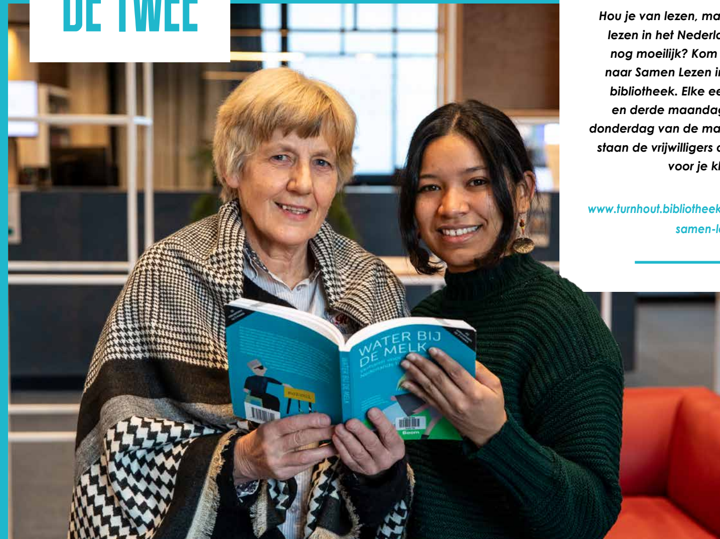
Leen Vrijwilliger bij Samen Lezen

WE LEZEN SAMEN EEN MOOIE TEKST MET EEN TASJE KOFFIE