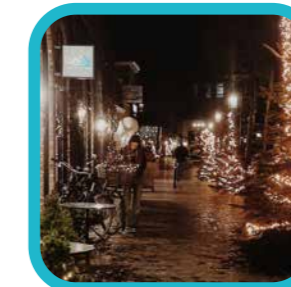
finnesview Winter in Turnhout

Water en vuur op de foto's van november en december. Wie stuurt iJzige foto's in van januari en februari?