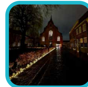
petra.peeters.101 #christmaseve #candleinthedew