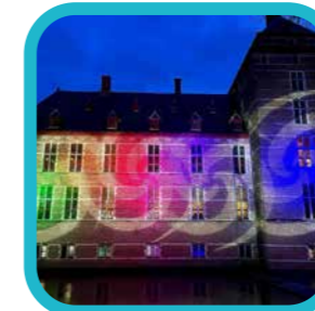
liesbethje1984 Dinsdagochtend 2/1/2024 [...]