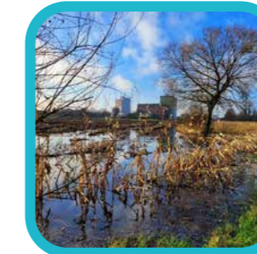
maxxco Moet er nog water zijn...