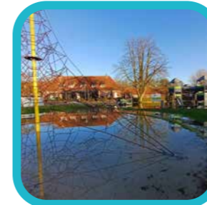
bieteutje #waterspiegeling #wateroverlast