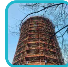
digit.all.photo "The sky is the limit"