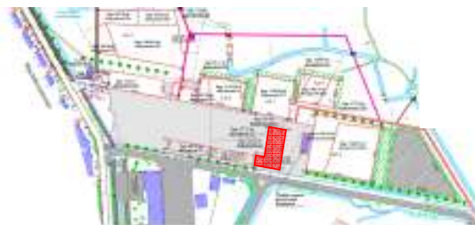
Detail invulling sport