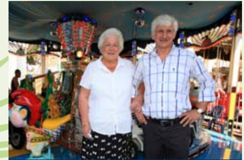
'Mijn vrouw en ik zouden alles terug overdoen.'

'Mijn vrouw en ik zouden alles terug overdoen want voor ons was het fantastisch! We hebben geluk gehad om altijd gezond en wel ons werk te mogen doen. Vooral vorig jaar was voor ons ongelooflijk mooi door de vele vieringen. Het was een zeer dankbaar en ontroerend afscheid. Dat hadden we nooit verwacht en we zullen het zeker nooit meer vergeten!'