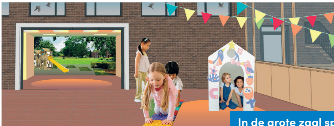
In de grote zaal spelen de kinderen. Hier is ook ruimte voor feestjes. Door de open deur kijk je naar de speelruimte op het plein.