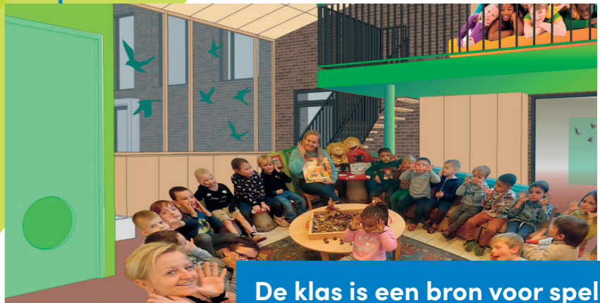
De klas is een bron voor spelen en leren, met hoeken en plekken voor allerlei activiteiten.