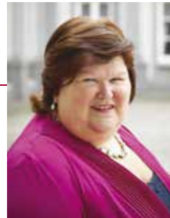
Maggie De Block

“Als (LEIF) arts ben ik vaak geconfronteerd geweest met mensen die onvoorstelbaar leden. Daarom is het goed dat er palliatieve zorg en onder strikte voorwaarden een regeling voor euthanasie bestaat. De LEIFkaart is een nuttig document dat elke mens bij zich zou moeten dragen en waarop de persoonlijke wilsverklaring van de betrokkene staat.”