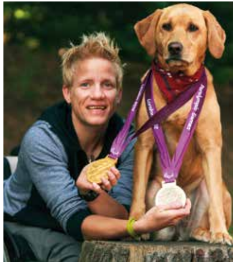
Marieke Vervoort, goud en zilver, Paralympics, London, 2012 mascotte W.E.M.M.E.L., expertisecentrum 'Waardig LevensEinde'

Sinds mijn papieren met betrekking op mijn levenseinde in orde zijn, dankzij LEIF en ULteam, ben ik bij wijze van spreken weer gaan “leven”. Met de gedachte dat ik niet onnodig hoeft af te zien als het te erg wordt, dat er een “noodrem” bestaat. Hierdoor is er een hele hoop stress van me afgevallen en kan ik opnieuw genieten van elk allerkleinste moment! Ik hoop dat het taboe rond het levenseinde wegvalt. Dit zou heel wat meer levenskwaliteit brengen!