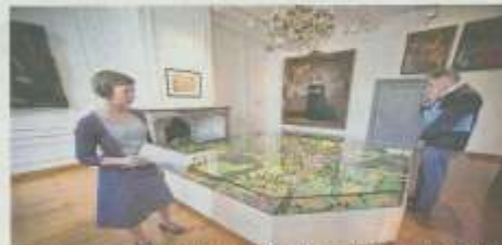
De maquette van Turnhout kwam als winnaar uit een oproep om het belevingsstuk van het museum aan te duiden. "Om het beter zichtbaar te maken voor het publiek, hebben we er de poten onderuit gezegd."

• Een toegangskaartje voor het vernieuwde Taxandriamuseum kost zondag 14 september niets. Ook de rondleidingen zijn er van 11 tot 17u gratis. Vanaf 14u staat er een verkleedkoffer met dure historische kledij en zijn er foto's die u in die kledij wilt fotograferen. Daarvan wordt ter plekke een affiche gemaakt. • Tot 1 november is er ook een wedstrijd. Wie drie originele argumenten om naar Turnhout te komen kan formuleren, maakt kans op een exclusief verblijf in hotel Taxandria. Een unieke kans, waarbij ook een ontbijt met bubbels hoort. Deelnemers kan door drie doorlaggevende argumenten te sturen naar trama@turnhout.be . DNW