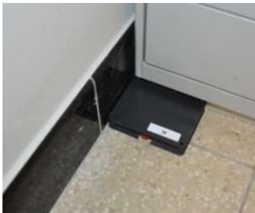
Plaatsing van lokdozen

De tweede fase van de houtwormbehandeling in het Begijnhofmuseum eindigt begin 2015. De papieren fiches met alle informatie over de objecten worden in 2015 geïmplementeerd in het collectieregistratiesysteem.