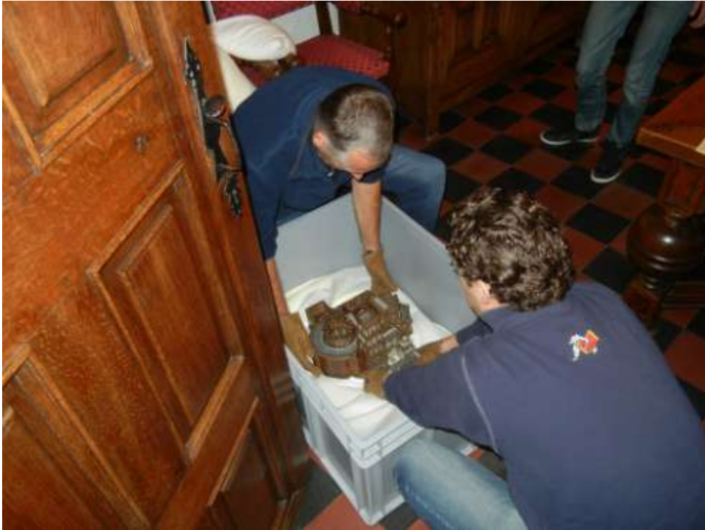
transport Maquette van de H. Grafkerk , bruikleen aan het MAS

B0064 Orde der Franciskanen te Jeruzalem, Maquette van de H. Grafkerk en de crypte te Jeruzalem