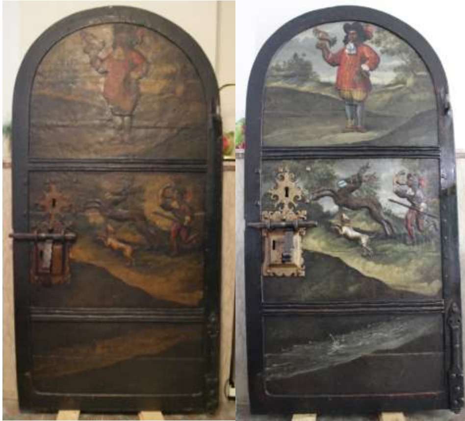
Behandeling Archiefdeur van het Valkenhof voor (links) en na (rechts)

In het Taxandriamuseum is er op verschillende plaatsen UV-werende folie tegen de ramen aangebracht. Daar waar het niet mogelijk was, is er een rolgordijn met UV-werende folie geïnstalleerd.