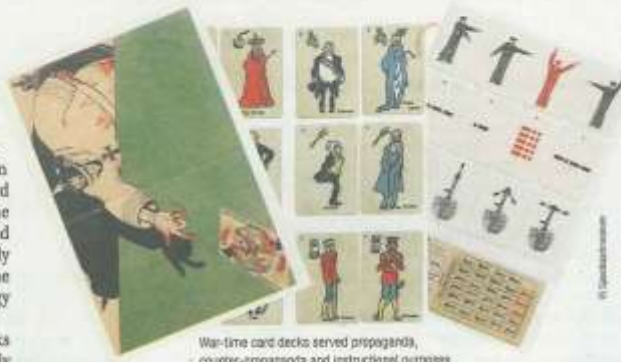
War-time card decks served propaganda, counter-propaganda and instructional purposes