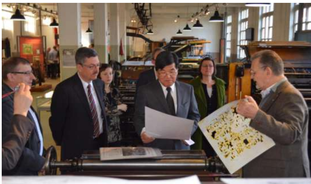
Bezoek Japanse ambassadeur aan Speelkaartenmuseum, in bijzijn van Cartamundi

In bovenstaande tabel zijn de bezoekcijfers van de tentoonstelling op locatie "Wereldberoemd in Turnhout" in Woonzorgcentrum De Wending en Woonzorgcentrum Sint-Lucia meegerekend. Er hebben naar schatting 1.000 personen deze tentoonstellingen gezien.