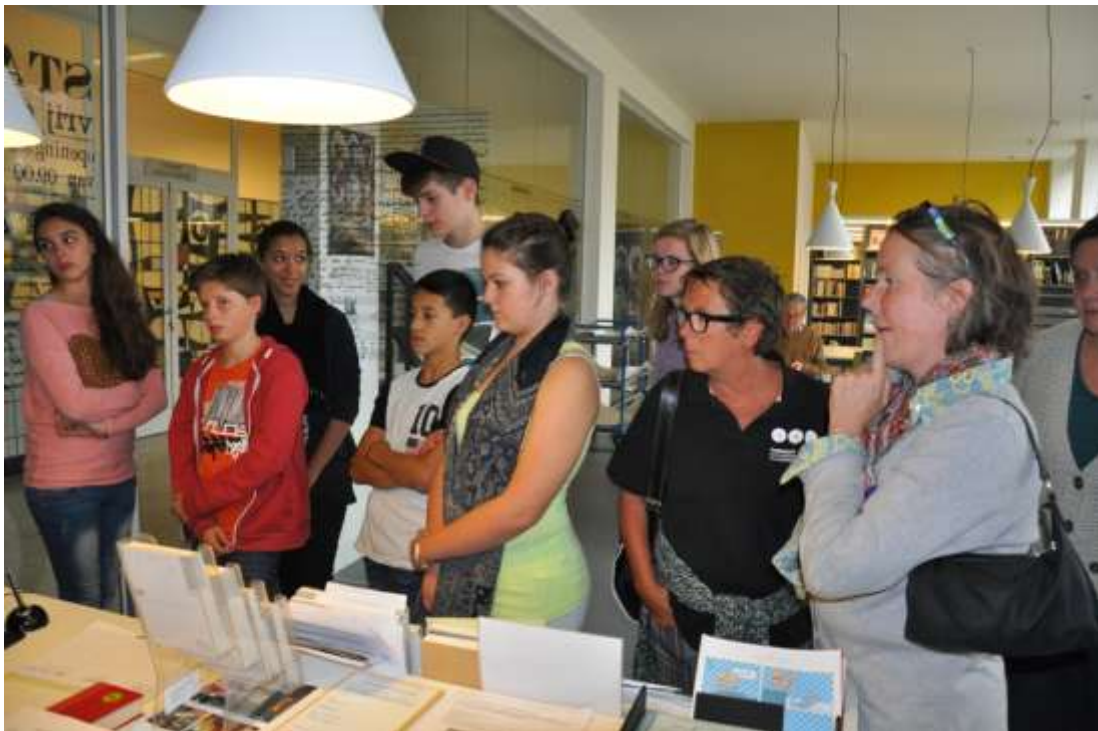
Workshop “digital storytelling” met de jongerengidsen in het Stadsarchief