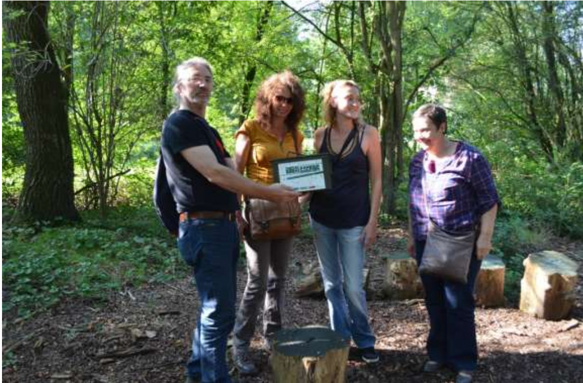
Bier & Pizza 2014

Een aantal opleidingen werden gevolgd door verschillende medewerkers, o.a. 'change management', deelname aan het Groot Onderhoud, de Masterclass van John Falk 1-2/12 (Tongeren), studienamiddag voor leeszaalmedewerkers, Summer School samen met National Archives, "Education Service" (georganiseerd door FARO), 'onderhoud in het depot', enz. Een gedetailleerd overzicht kan op aanvraag worden bezorgd. Verder werden werkbezoeken afgelegd aan o.m. het Scheepvaartmuseum Amsterdam, Louvre Lens (F), IJzertoren, Red Star Line Museum, Texture Kortrijk.