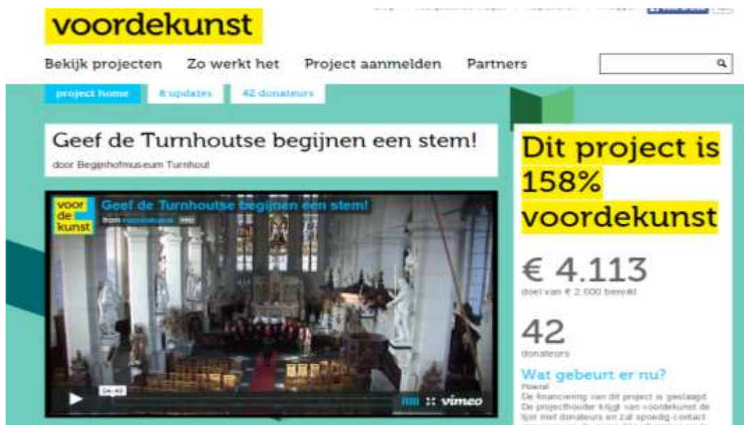
Screenshot van project op www.voordekunst.nl