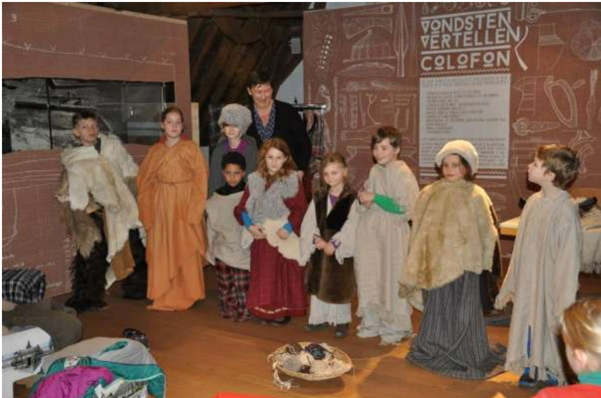
Workshop “wat trek ik aan?”, Taxandriamuseum

Met de medewerking van het Stedelijk Museum Hoogstraten.