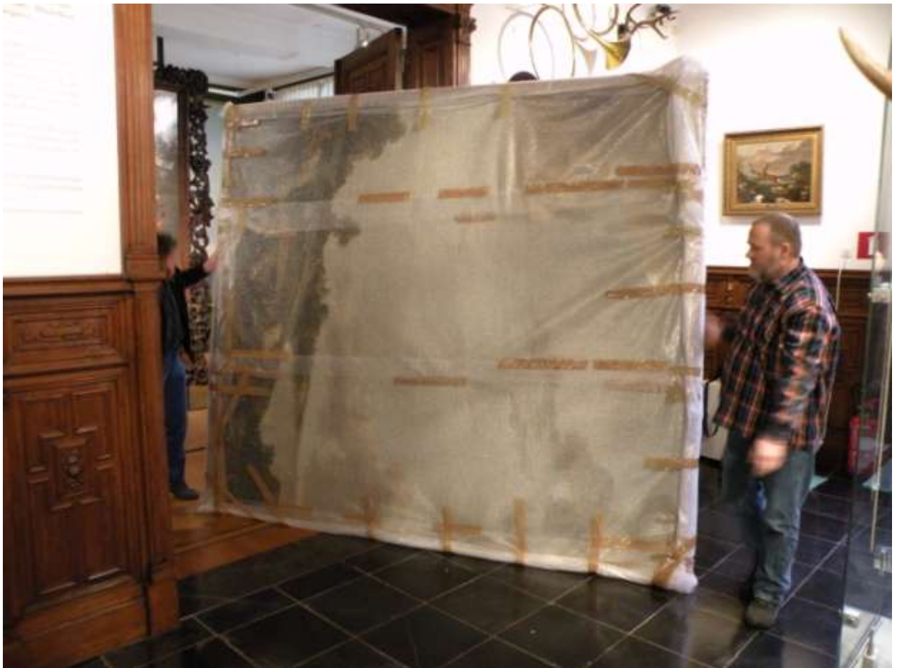
Kunsttransport Landschap met koeien en schapen door Xavéry, Taxandriamuseum