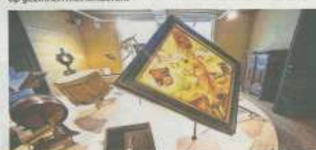
In de kamer van de torenwachter staat de bugel van de laatste Turnhoutse torenwachter centraal. Daaronder staan attributen die verwijzen naar de verschillende veldslagen en oorlogen die in en rond Turnhout zijn gevoerd.