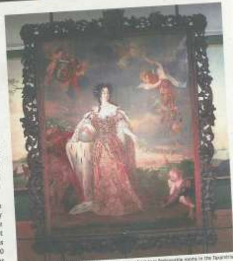
The prominent women of Turnhout in 16th-century dress visit two fashionable women in the Taxandria

The deer moved into the hotel with the ladies last year. His room tells of the forests and fields of the Kempen, beloved hunting grounds of old for dukes and duchesses. The region was famous for falconry, and a deer can still be seen in the city's coat of arms. Hunters, however, were not the only ones drawn to the Kempen. Even today, artists find inspiration in its beautiful nature. Hotel Taxandria opened last year, and several new guests have recently checked in. They are seven archetypal figures, introduced to further illustrate the history of the region and help connect the museum's multigenerational collection. The archaeologist lives in a room filled with shards of ancient pottery and other remains found in the local soil. He explains that the first inhabitants were Neanderthals who lived here more than 200,000 years ago. In 57 BC, Julius Caesar invaded the territory and defeated the Eburones and Menapii tribes. Several Germanic tribes, including the Taxandri, eventually took their place. In the attic, visitors meet the lace-makers. In the 17th century, nuns as well as secular women began making lace in Turnhout. Their work earned the city the reputation of Bruges' biggest rival, but the wages were so low that the entire industry was seen, in retrospect, as an exploitation of women. This critical aside included on the