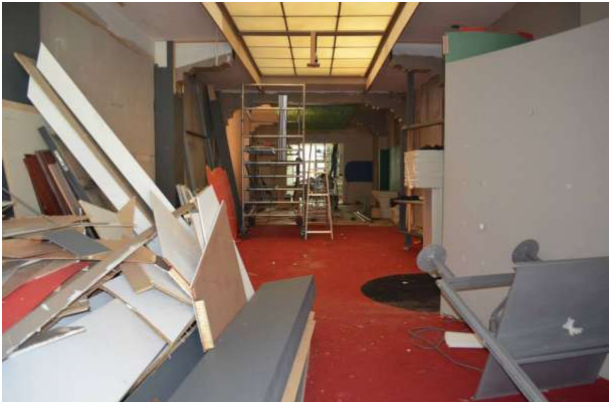
Renovatie nieuwe tentoonstellingsvleugel in Museum van de Speelkaart

Er liepen onderhandelingen met Cartamundi over de inrichting van een tentoonstellingsvleugel met hedendaagse toepassingen van speelkaarten.