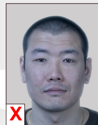
C. Onnatuurlijke weergave