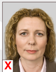
B. Optische vervorming