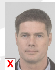
D. Onvoldoende contrast (flets)