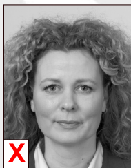
A. Zwart / Wit*