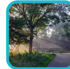
jef.debacker Mooi licht op mijn ochtendwandeling.