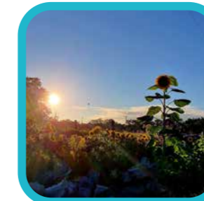
petra.peeters.101 Zalige zomeravonden

Een laatste terugblik op de Turnhoutse zomer, bij dag én bij nacht. Alsof het altijd mooi weer was!