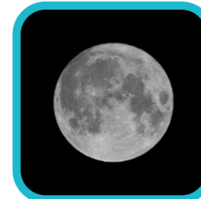
digit.all.photo "Blauwe Maan"